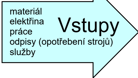
Schéma nákladů a výnosů